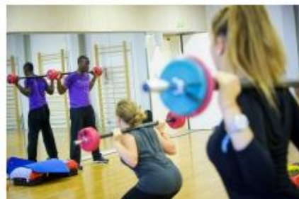
Métiers de la Forme