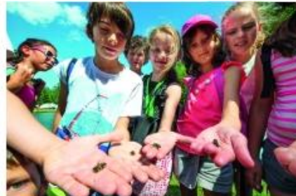
Multiactivité APT LTP