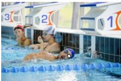
Aquatique et Natation