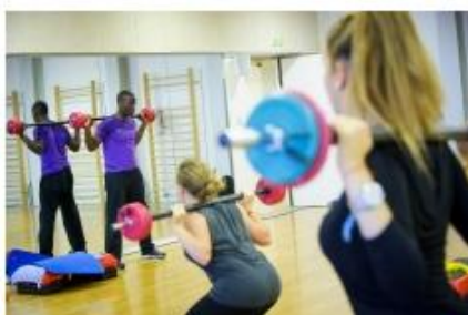
Métiers de la Forme