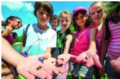
Multiactivité APT LTP