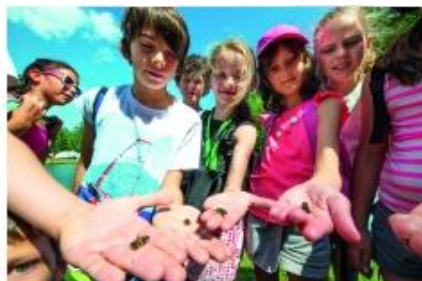
Multiactivité APT LTP