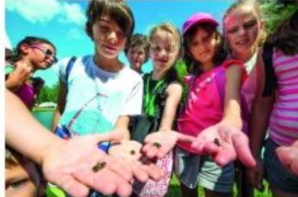
Multiactivité APT LTP